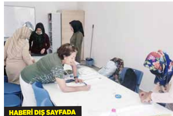
HABERİ DİŞ SAYFADA

Sincan Belediyesi'nin Fatih'te açılan Kültür ve Sanat Merkezi ile Zeytin dalı Kültür Merkezi'nde kadınlar için açılan sepetçilik ve giyim kursları büyük ilgi gördü.