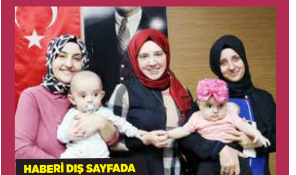
HABERİ DİŞ SAYFADA