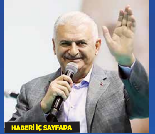
HABERİ İÇ SAYFADA

TBMM Genel Kurulu, 27. Dönem 6. Yasama Yılı'nın başlaması dolayısıyla Meclis Başkanı Mustafa Şentop başkanlığında özel gündemle toplandı. Cumhurbaşkanı Recep Tayyip Erdoğan, yasama yılı açılış programında açıklamalarda bulundu. Cumhurbaşkanı Erdoğan, "İçimizde ukde kalan bir mesele de ülkemizi, sivil, demokratik, vizyoner bir anayasaya kavuşturmak. Samimi çağrılar ülkemizi böyle bir kazanımla buluşturmaya yetmedi. Yeni dönem Meclisimizin Türkiye'yi hakkı olan yeni anayasa buluşturarak darbe dönemlerinin izini de sileceğine inanıyorum." ifadelerini kullandı. Erdoğan, "Yılbaşında tüm ücretlerin durumunu, kayıpların telafi edecek şekilde gözden geçireceğiz. Hiçbir vatandaşımızın enflasyonun altında ezilmesine izin vermeyeceğiz." dedi. Erdoğan, "Yerli elektrikli otomobilimiz TOGG'un Gemlik'teki fabrikasını 29 Ekim'de açıyor, seri üretimi başlatıyoruz" dedi.