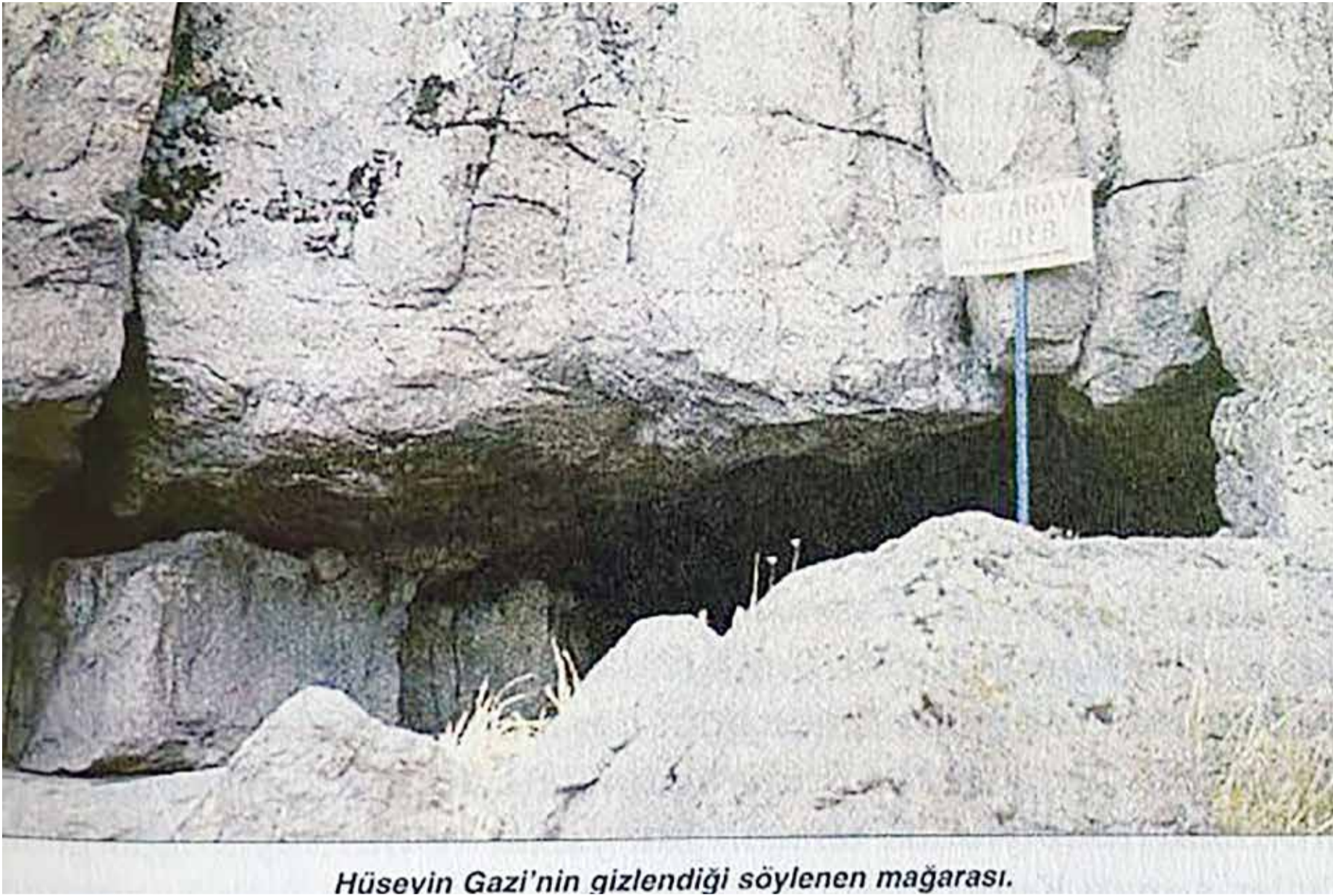
Hüseyin Gazi'nin gizlendiği söylenen mağarası.