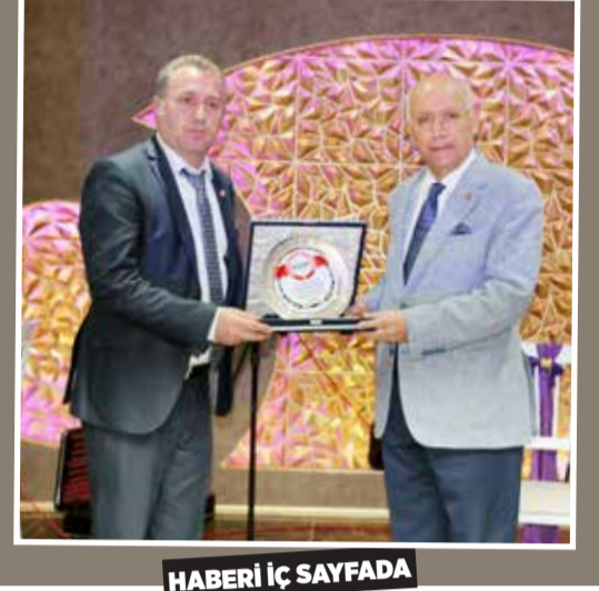
HABERİ İÇ SAYFADA