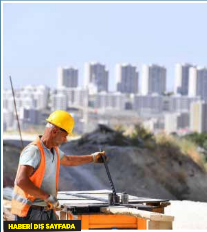
HABERİ DIŞ SAYFADA

PORTAŞ ekipleri, konutların en kısa zamanda tamamlanması için bölgede çalışmalar hızla devam ediyor.