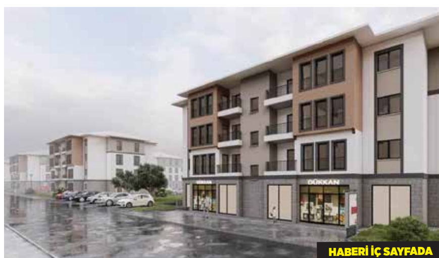
HABERİ İÇ SAYFADA

Çevre, Şehircilik ve İklim Değişikliği Bakanlığı, Cumhuriyet tarihinin en büyük sosyal konut hamlesi olan "İlk Evim İlk İş Yerim" projesi başvurusuna ilişkin sıkça sorulan soruların cevaplarını yayımladı.