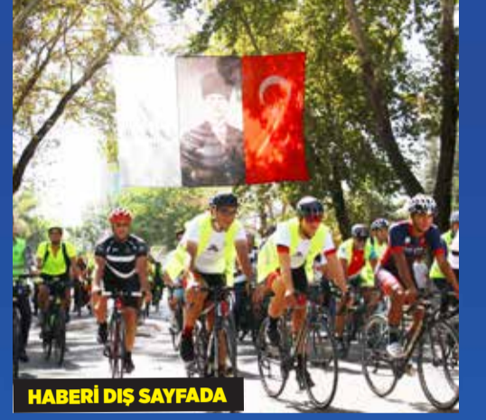
HABERİ DIŞ SAYFADA