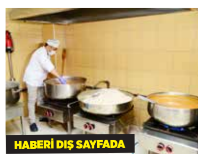
HABERİ DIŞ SAYFADA

Kahramankazan Belediyesi, ihtiyaç sahibi, hasta ve yaşlı vatandaşlara yönelik ücretsiz sıcak yemek servisi hizmetini aralıksız sürdürüyor.