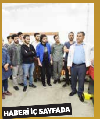
HABERİ İÇ SAYFADA

Ankara Büyükşehir Belediyesi ve Gazi Üniversitesi iş birliğiyle düzenlenen Teknik Eğitim Kurslarında (BEL/TEK) yeni dönem ön kayıtları 19 Eylül tarihinde başlıyor. Akademisyenler tarafından 8 ana başlıkta, 65 kursun ücretsiz olarak verileceği programa başvuru yapmak isteyenler https://beltek.gazi.edu.tr/ adresi üzerinden 27 Eylül tarihine kadar ön kayıt işlemlerini yapabilecekler.